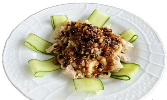
花香雲白肉 680 円

(かこうらんぱいろう) 国産バラ肉を使った冷菜。 青花椒とにんにくの香りが食欲をそそります。豚肉とにんにくは、疲労回復にもぴったりです。