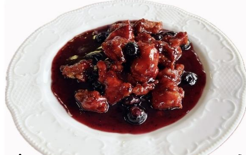
ブルーベリー酢豚 980 円

(かこうらんぱいろう) 国産バラ肉を使った冷菜。 青花椒とにんにくの香りが食欲をそそります。豚肉とにんにくは、疲労回復にもぴったりです。