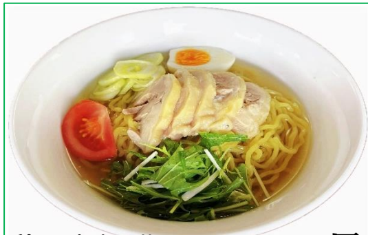
鶏の冷やし塩ラーメン 900 円

刻み梅の爽やかな酸味と、ゆかり赤紫蘇塩の香りが広がる炒飯。 しらすの旨味と調和し、後味もさっぱりとしています。