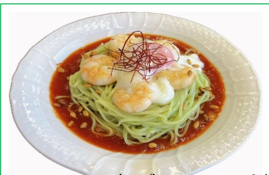
海老チリー混ぜそば(クロレア麺) 980 円

しっとり柔らかな鶏チャーシューに、旨味たっぷりの塩だれを合わせた冷たいラーメンです。さっぱりとした味わいで、最後まで飽きずに楽しめます。