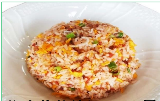
梅赤紫蘇炒飯 900 円

甘酸っぱいブルーベリーソースで仕上げた酢豚です。ポリフェノールたっぷりで、おいしく食べながら体の中からリフレッシュできます。